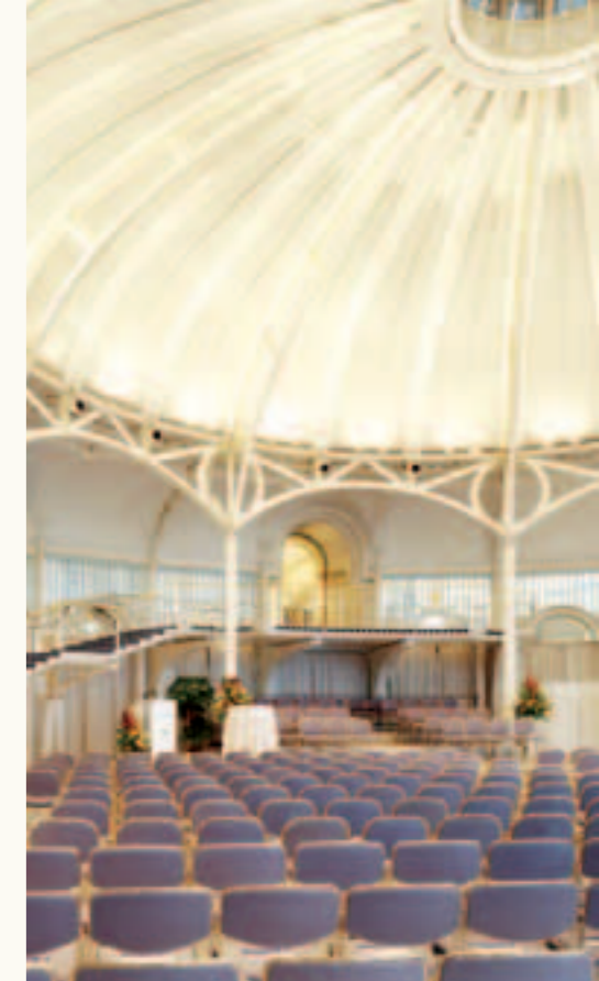
Steigenberger Grandhotel Petersberg

*Dieses Programm richtet sich an alle Begleitpersonen der Teilnehmer der Petersberger Gespräche